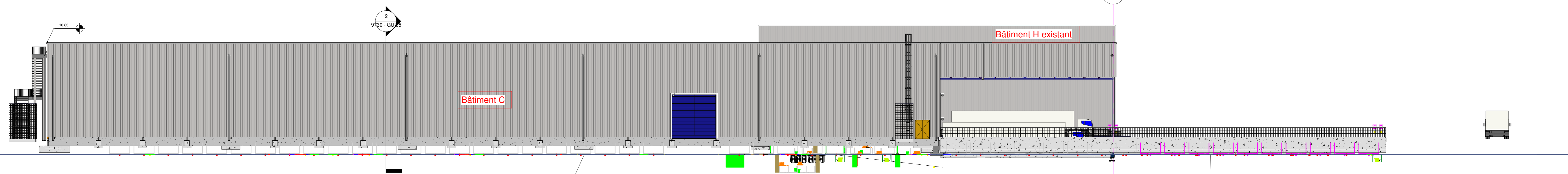
3 Elévation Sud 1 : 200